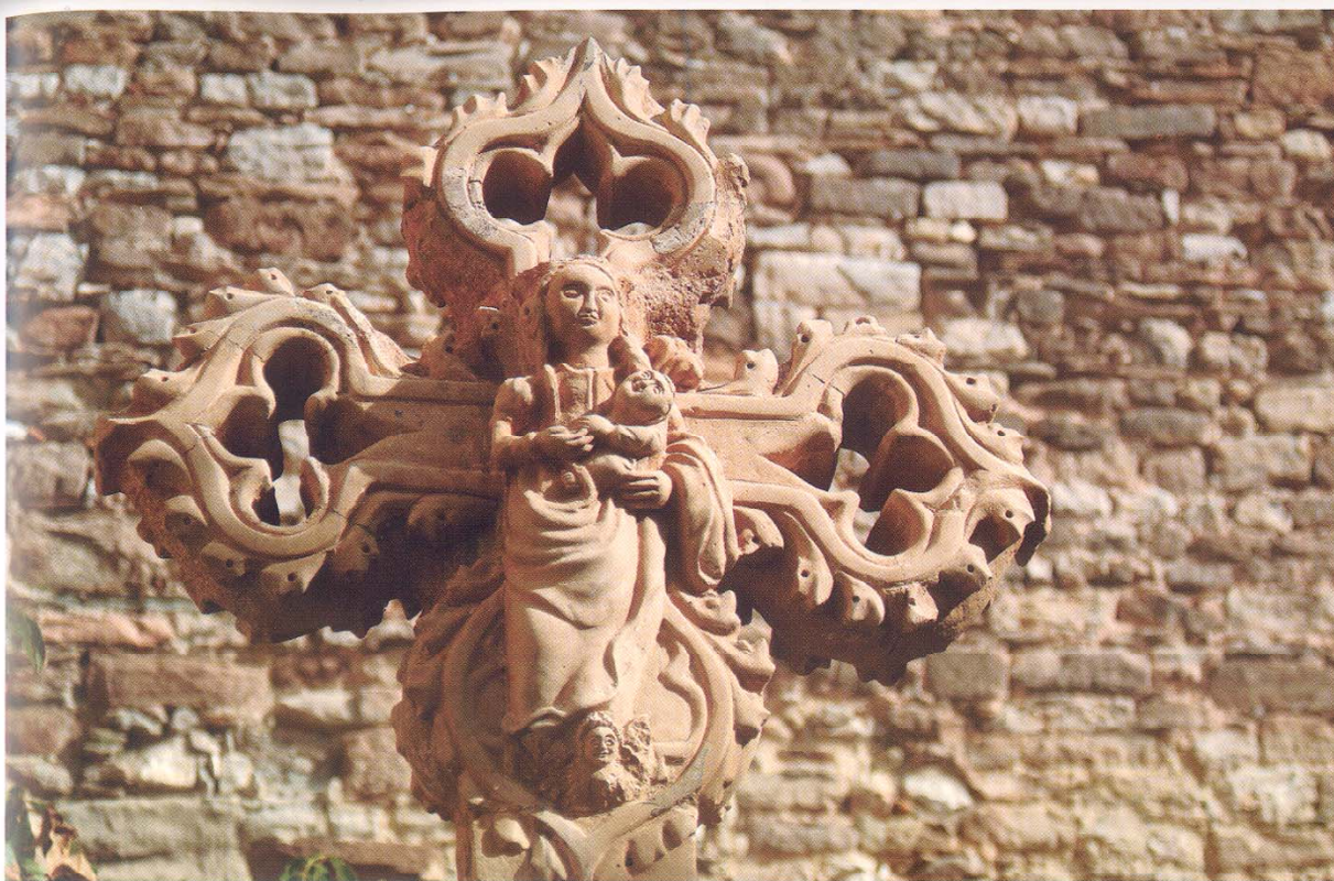
La creu del Remei, ubicada abans a la capelleta del cementiri, és una de les creus de terme de la vila de Moià.